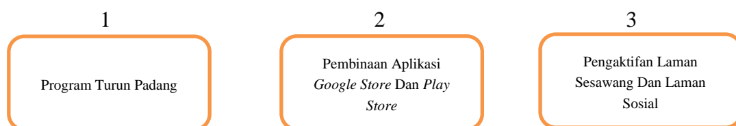
(Rajah Memartabatkan Institusi Fatwa Melalui Kaedah Ketiga)

Melalui kaedah ini, institusi fatwa dapat dimartabatkan dengan melakukan program turun padang di semua tempat yang menjadi tumpuan masyarakat seperti masjid surau, pasaraya, dan lain-lain. Antara program yang boleh dilaksanakan ialah klinik hukum hakam dan penjelasan fatwa-fatwa. Selain daripada itu, bersesuaian dengan perkembangan teknologi semasa, aplikasi mudah alih Google Store bagi Android , dan Play Store bagi Iphone yang memuatkan maklumat sejarah latar belakang institusi fatwa, koleksi-koleksi fatwa lepas dan kemudahan pertanyaan soalan perlu dibina. Di samping itu juga, laman sesawang institusi fatwa dan juga laman sosial sama ada dalam bentuk Facebook , Instagram , Twitter , mahupun Tik Tok haruslah diaktifkan.