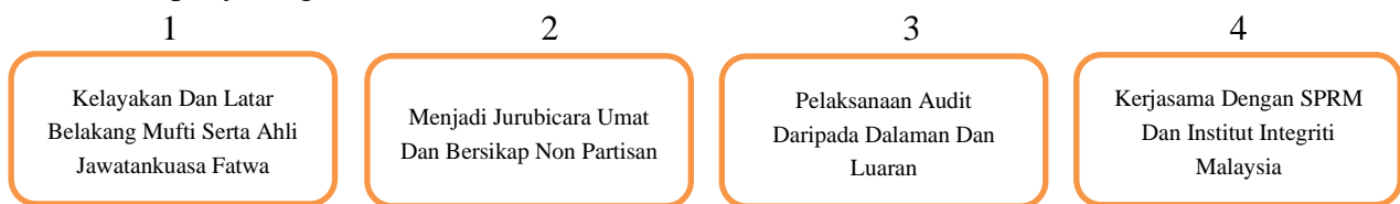
(Rajah Memartabatkan Institusi Fatwa Melalui Kaedah Kedua)

Dari sudut meningkatkan integriti dan kredibiliti institusi fatwa, segala urusan perbelanjaan wang dan pendapatan dilakukan pengauditan sama ada audit dalaman dan juga audit daripada pihak luar. Di samping itu juga, institusi fatwa perlu mengadakan kerjasama dengan institusi seperti Suruhanjaya Pencegahan Rasuah (SPRM) dan juga Institut Integriti Malaysia supaya dapat diiktiraf sebagai sebuah institusi yang bersih daripada sebarang elemen rasuah dan penyalahgunaan kuasa.